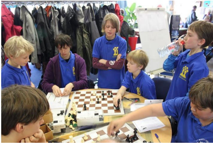
Promotie-jeugd analyseert tijdens Jeugd Club Competitie 2011 in Amersfoort