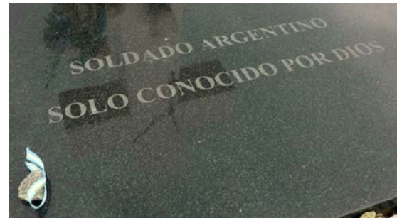
Argentijns soldaat alleen bekend bij God.

Het nieuws dat de Argentijnse kranten, klik hier , tijdens ons verblijf beheerste was het bezoek van een grote groep Argentijnse nabestaanden aan de graven van soldaten die tijdens de oorlog om de Islas Malvinas, a.k.a. Falkland Islands, sneuvelde, klik ook hier (The Guardian) en hier (The New York Times). Tijdens deze absurde oorlog, die in 1982 van 2 april tot 14 juni werd uitgevochten, kwamen 649 Argentijnen en 258 Britten om. Negenhonderd doden in een oorlog om een paar eilanden bij het zuidelijkste punt van Zuid-Amerika, waar nog geen 2000 mensen woonden. Het oordeel van de Argentijnse dichter Jorge Luis Borges over deze oorlog was vernietigend ' De Malvinas was een oorlog tussen twee kale mannen om een kam! ' met als zijn tragische slachtoffers ' Juan López y John Ward ' (1982), klik hier (Spaans) en hier (Engels).