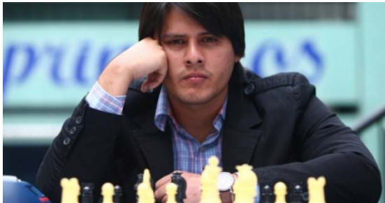
GM Emilio Córdova Daza (Lima, Peru, 08-07-91)

Lange tijd heb ik gedacht dat de Peruaanse GM Julio Granda Zuñiga als nummer één van zijn land het eeuwige leven had. Begin januari viel het mij echter op dat de nummer 100 van de FIDE ranglijst GM Emilio Córdova Daza uit Peru was. Hé, twee Peruanen in de top 100 van de FIDE was mijn eerste gedachte, maar bij nader inzien bleek het er maar één te zijn. Er was sprake van aflossing van de wacht. Córdova bleek Granda overvleugeld te hebben.