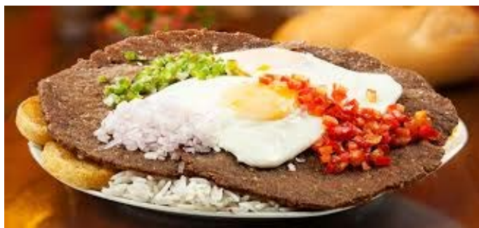
De inzet: Silpancho